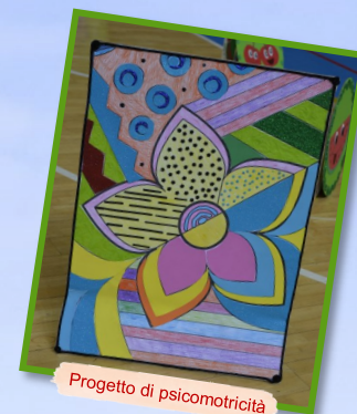
Progetto di psicomotricità

Visita virtualmente la nostra scuola per conoscere il PIANO TRIENNALE DELL'OFFERTA FORMATIVA https://gat.to/zlv1x