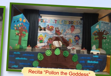
Recita "Pollon the Goddess"