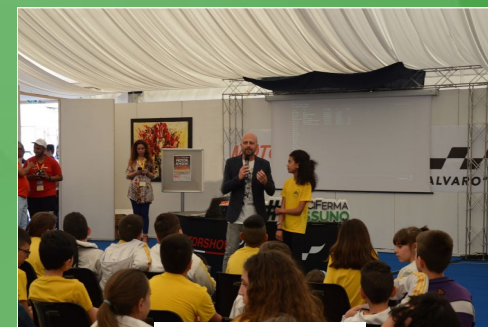
Al Motor show "Due Mari"