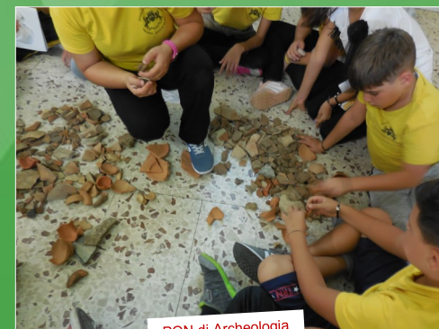
PON di Archeologia