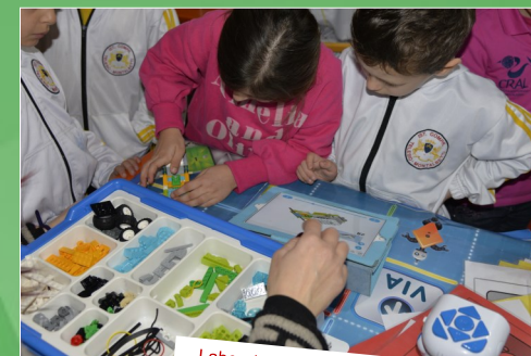
Laboratorio di robotica