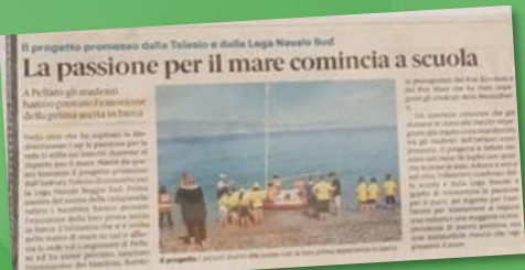
Gazzetta del Sud, 14 settembre 2019