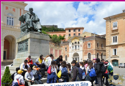
Viaggio di istruzione in Sila