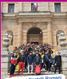
Viaggio ai Castelli Romani