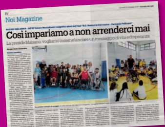
Gazzetta del Sud, 31 ottobre 2019