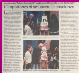
Gazzetta del Sud, 2018