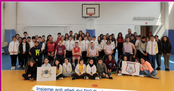
Insieme agli atleti del BIC Basket in Carrozzina