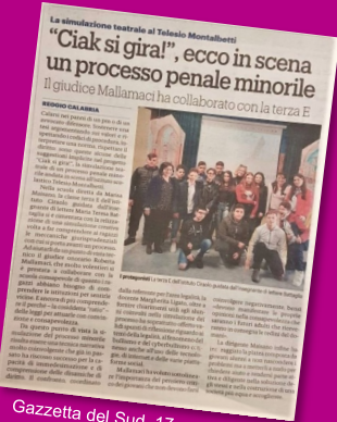
Gazzetta del Sud, 17 aprile 2019