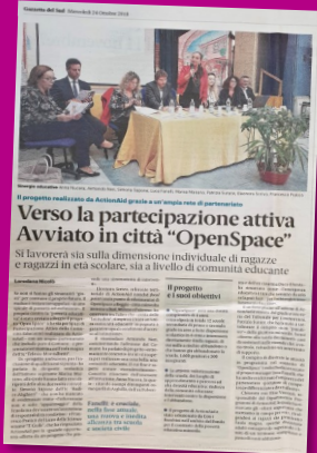
Gazzetta del Sud, 24 ottobre 2018