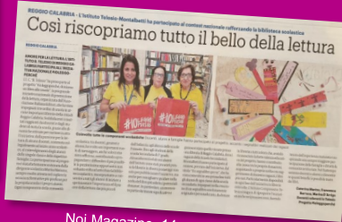
Noi Magazine, 14 novembre 2019