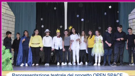
Rappresentazione teatrale del progetto OPEN SPACE